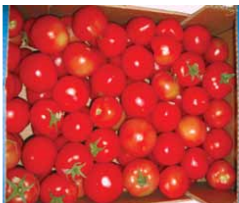
MADHËSIA E PËRZIER

(NGA 3 DOMATE NË RRJESHT - DIAMETRI 82+MM)